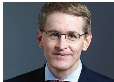
• Schirmherr Daniel Günther, Ministerpräsident von Schleswig-Holstein, wollte per Video-Botschaft ein Nowruz-Grußwort an die Organisatoren und Gäste richten.