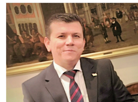
• Tadschikistans Botschafter Sohibnazar Gayratsho hofft, dass das Nowruzfest als eine jahrtausendalte Überlieferung in diesem Jahr ermutigt, weiterzumachen bzw. im Einklang mit der Natur und Gesellschaft einen neuen Anfang zu wagen.